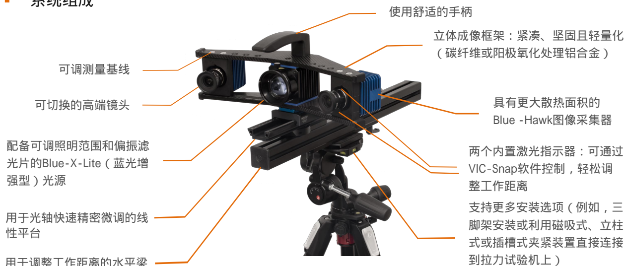
Blue-Hawk+ VIC-3D Hawk Mount